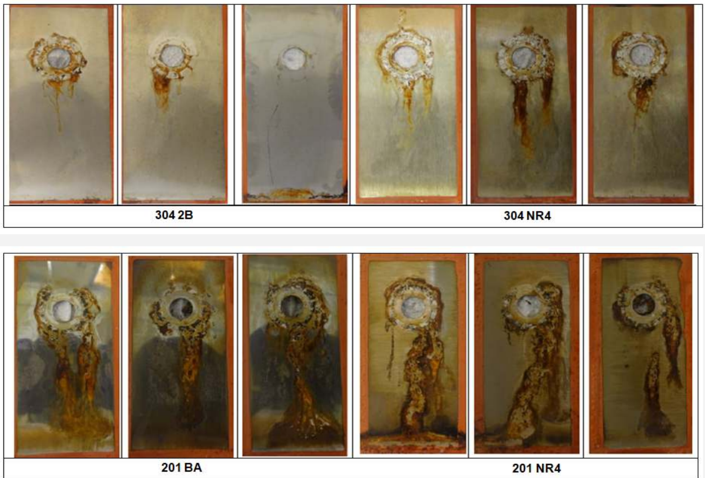
Figura 01 – Aspecto dos corpos de prova após 14 dias de imersão em solução de hipoclorito de sódio 2,5 % com dispositivo gerador de fresta. Os corpos de prova foram lavados com água corrente sob leve esfregamento, rinsados com água Mili-Q, álcool e acetona e depois secos com ar quente. Comparativo Inox 304 (8% Ni) x Inox 201 (1% Ni)

Nesse meio, foi verificada superioridade do aço 304 à corrosão por pite nos acabamentos 2B e NR4 em relação aos demais aços, com exceção do 439 que apresentou desempenho semelhante.