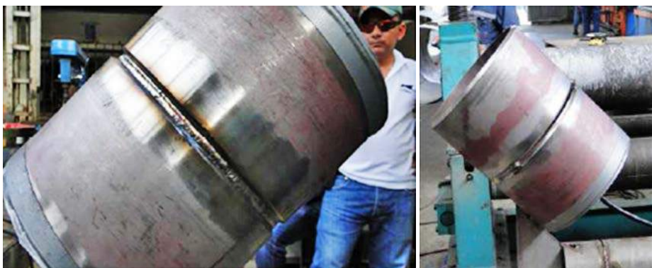
Limpar as superfícies a serem soldadas