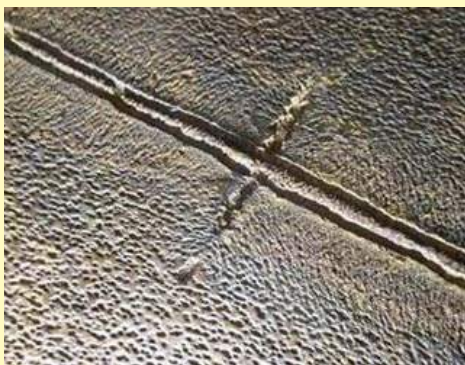
Corrosão do fundo em aço carbono, junto ao cordão de solda