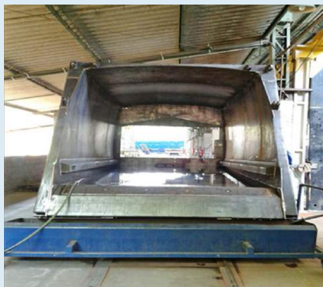
Caixa com fundo em inox

O aço inoxidável deve ser utilizado também em outras peças que compõem o sistema de coleta de lixo, como a bacia coletora, o painel transportador e o compactador dos caminhões de lixo, proporcionando assim uma solução ambiental completa.