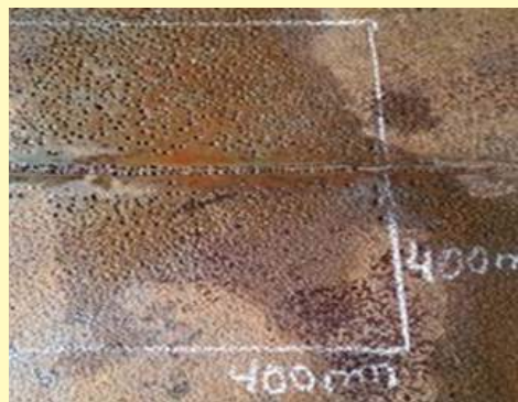
Corrosão no fundo de aço ao carbono comum