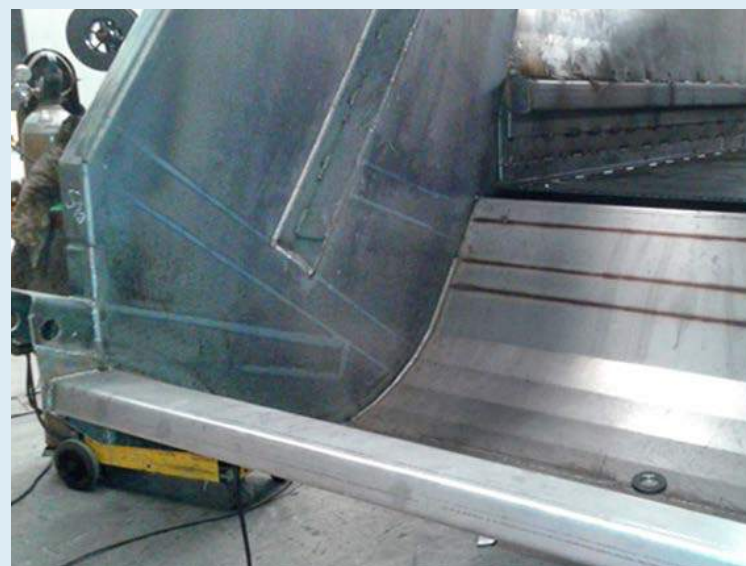
Fundo da porta de carga (boca) em inox