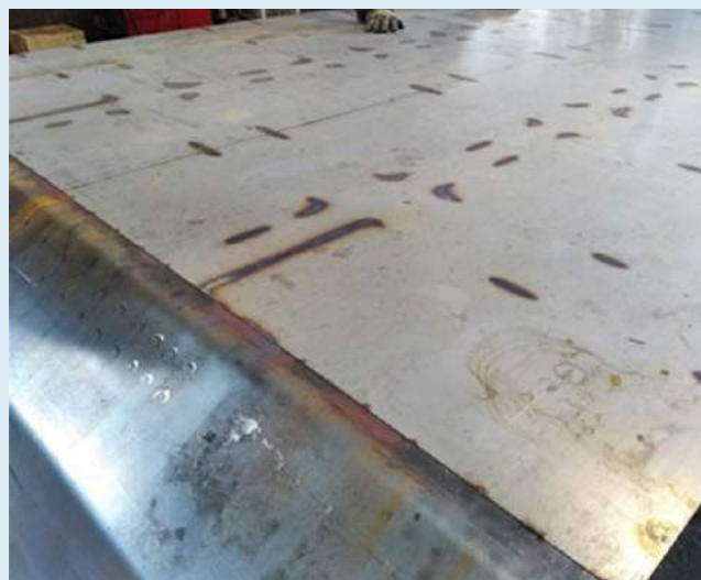
Aspectos do processo de montagem e soldagem do fundo da caixa