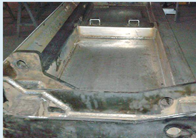
Painel empurrador ou pá coletora em aço inox