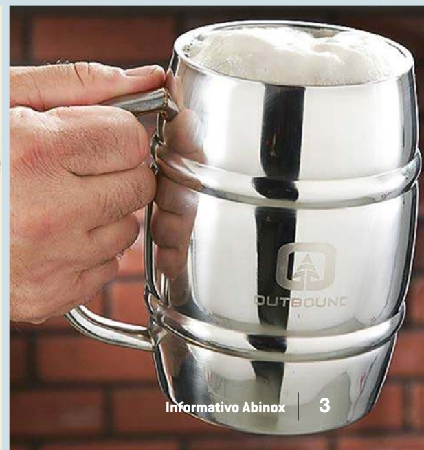
Aço inox ▶ 304, acabamentos brilhante e polido